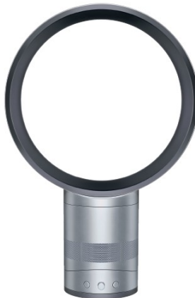
VENTILATEUR SANS PALE